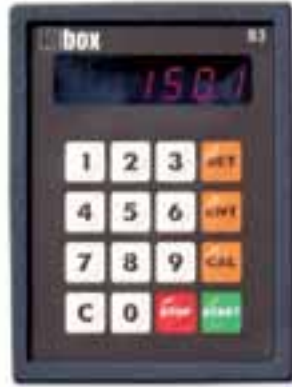
S3 Standart Kontrol Standard Controllers