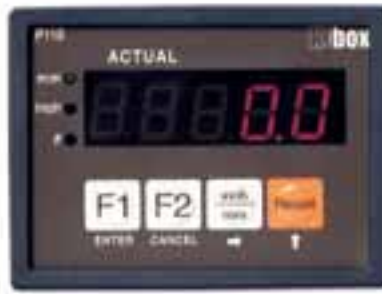
P110 Pozisyon Göstergesi Position Indicators